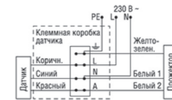
Схема подключения 25830 8